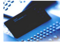
VoIP: Das Ende der restriktiven Anlagen-Services ist gekommen.

Avalaris führte eine Umfrage betreffend konvergenter Technologien unter Top-500-, Werbe-, Grafik- und anderen Unternehmen in Österreich durch. Als bereits im Einsatz befindliche konvergente Technologien wurden WLAN mit 29 Prozent, Mobile-Services mit 18 Prozent und Voice-Mail mit neun Prozent genannt - gefolgt von VoIP (sieben Prozent). Bei Technologien, die demnächst eingeführt werden sollen, nimmt die Technologie WLAN den unangefochtenen ersten Platz ein: fast 22 Prozent der Firmen geben an, Wireless-LAN in nächster Zeit implementieren oder ausbauen zu wollen. Weitere zehn Prozent denken an ein Aufrüsten auf Kommunikation per VoIP und vier Prozent der Befragten planen auf Mobile-Services zu setzen. Dreieinhalb Prozent haben Voice-Mail auf ihrer Roadmap.